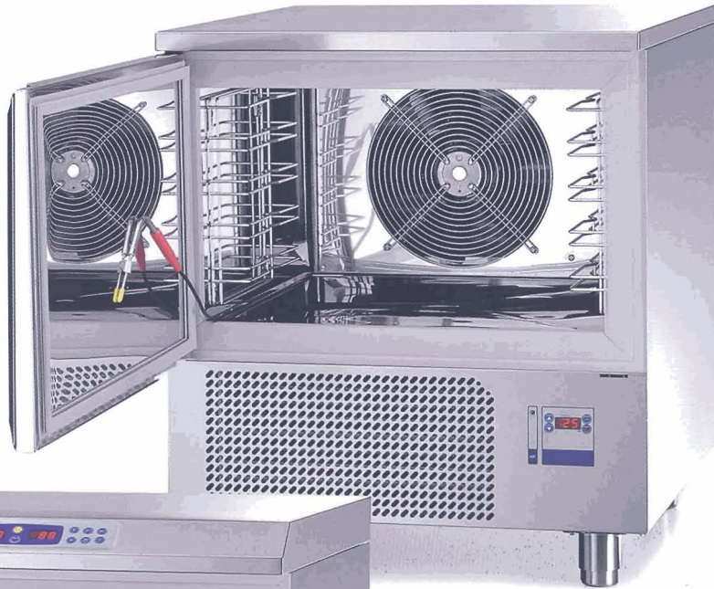
Basic AMX5 BASIC